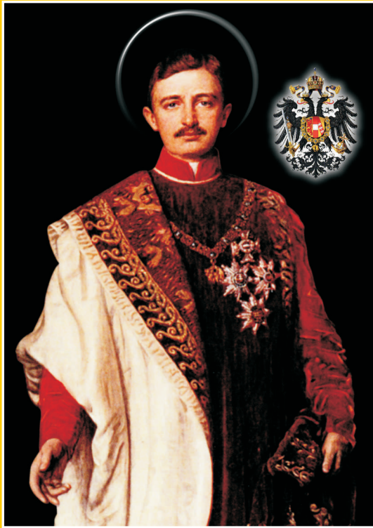
Blahoslavený Karle Habsburský přimlouvej se za lid Čech, Moravy a Slezska